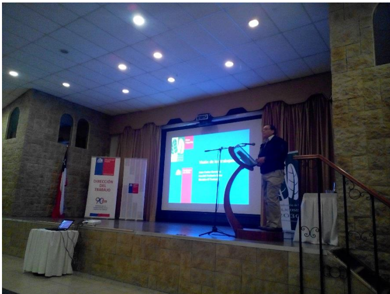
Trabajador representante CPHS, Codelco expone sobre la visión del PLANESI