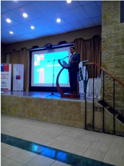
Empleador, Gerente Chesta Ingeniería, expone sobre la visión del PLANESI